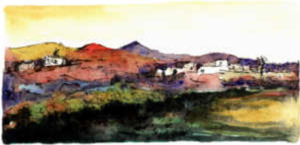
Aquarelle von Lanzarote