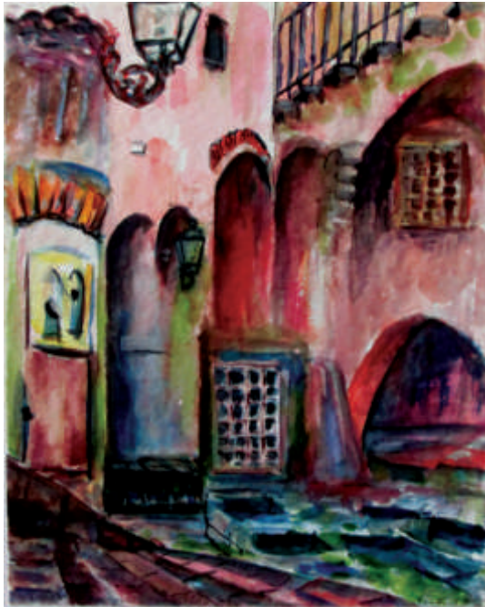
Aquarell „die Quellen von Cefalu auf Sizilien“

Und natürlich die rotleuchtenden Gemälde und Aquarelle der Kanaren-Insel Lanzarote.